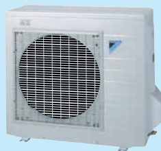
ヒートポンプユニット

停止日数を指定しておく、その間だけ運転を停止するのでムダがありません(最大10日まで)。停止日数を過ぎると、自動運転を再スタートします。上手に設定すれば家に帰ったその日からたっぷりのお湯が使えます。